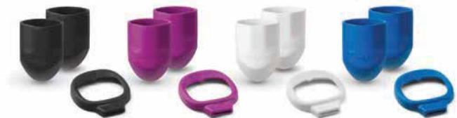
Protectores para mango y ventana

Puede ser personalizado usando el kit de accesorios* para que se adapte a su estilo.